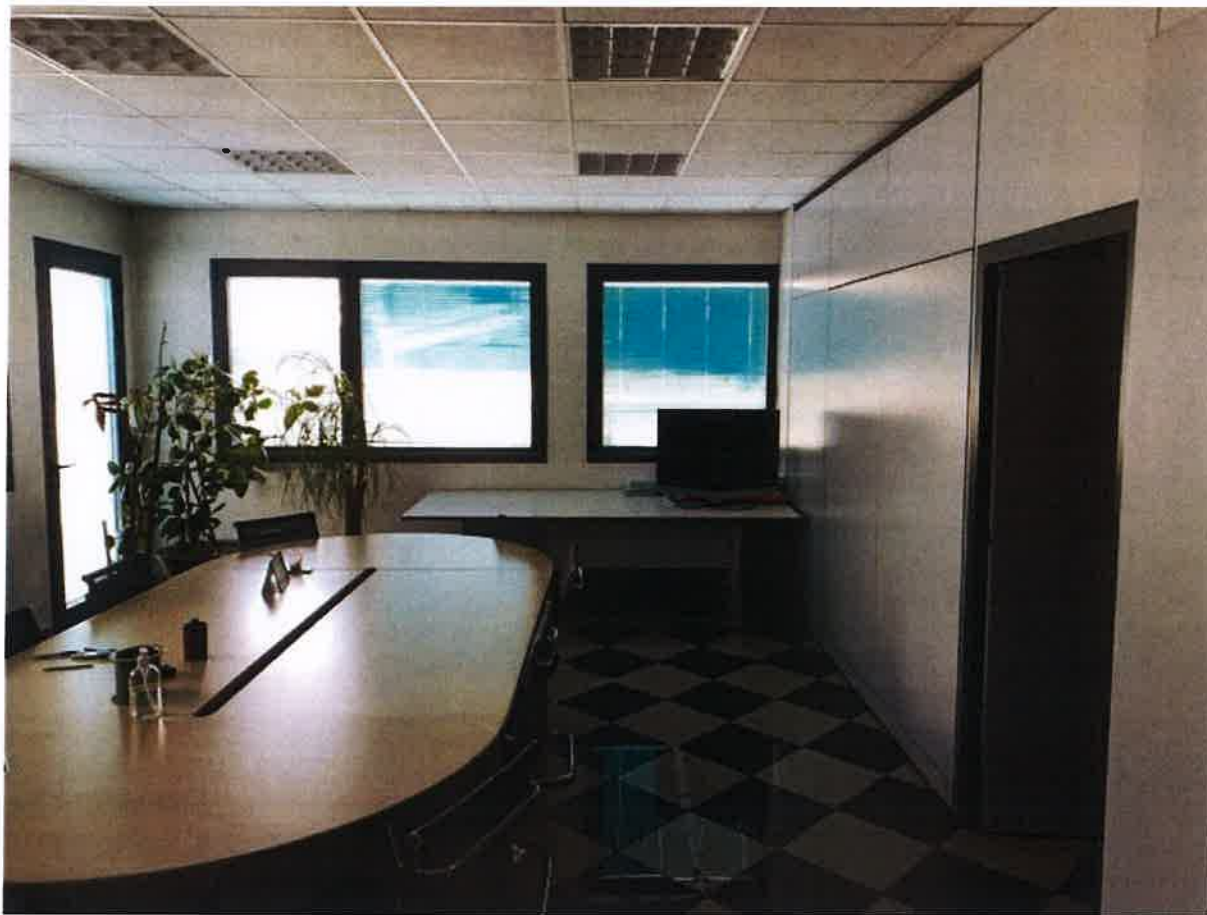
VISTA INTERNA LOTTO 1