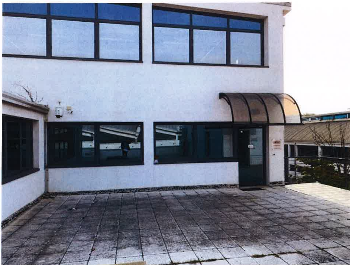
VISTA ESTERNA LOTTO 1