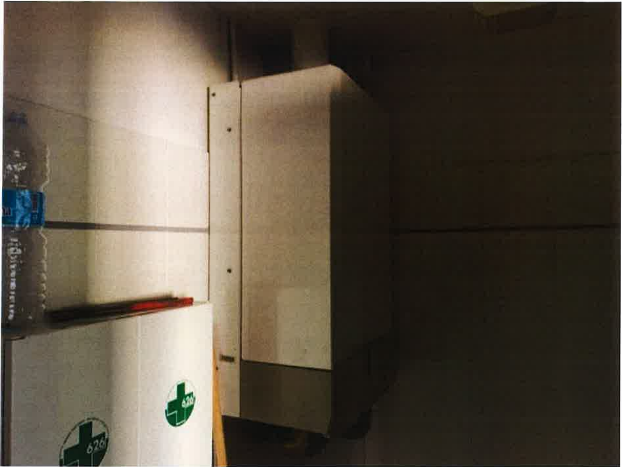
VISTA INTERNA LOTTO 1