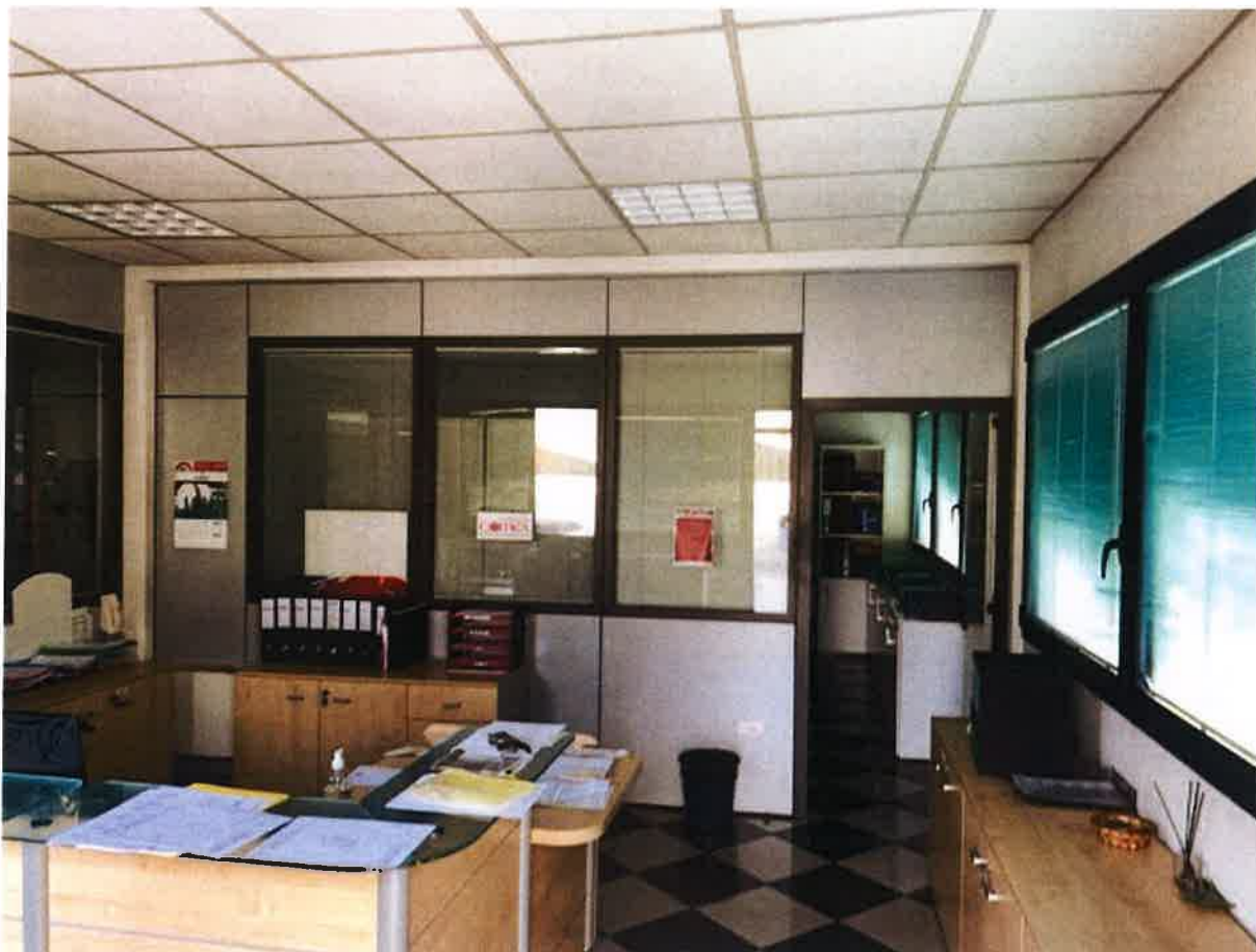
VISTA INTERNA LOTTO 1