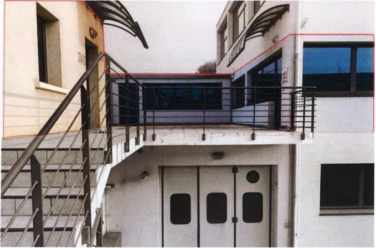
VISTA ESTERNA LOTTI 1 E 2